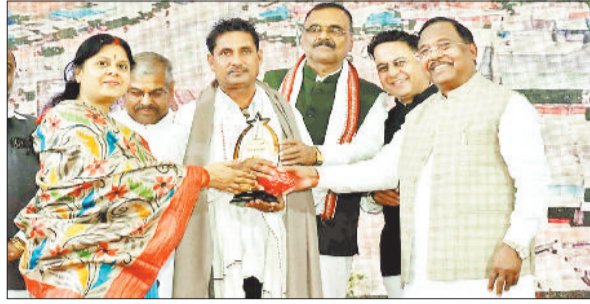
समाज सेवी को सम्मानित करते अतिथि।