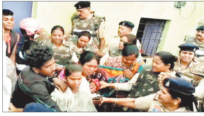
घर के सामने से लोगों को हटाते पुलिसकर्मी।