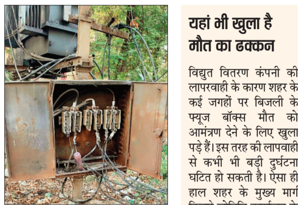
हरिभूमि न्यूज ►► बैकुण्ठपुर

जिनारे होने के कारण कई लोगों का आना-जाना रहता है, कई लोग वाहन की सवारी के लिए सड़क किनारे वाहन का इंतजार करते हैं, जिनके साथ बच्चे भी रहते हैं। ऐसे में कहीं अनजाने में कोई बच्चा खेलते हुए बिजली के खुले फ्यूज बाँक्स के पास चला जाता है और तारों के संपर्क में आ जाता है तो बड़ी दुर्घटना घटित हो सकती है, ऐसे में संभावित खतरे वाली उक्त जगह पर खुले बिजली के फ्यूज बाँक्स के ढक्कन को सुरक्षित बंद करने की जरूरत है, ताकि कोई मकड़जाल उलझा हुआ है। मुख्य मार्ग