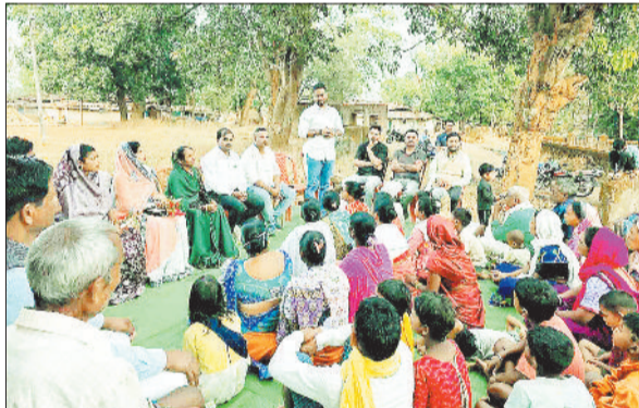
ग्रामीणों से चर्चा करते विधायक।

विकासखंड बतौली क्षेत्र में कई ऐसे गांव हैं जो आज भी विकास से कोसों दूर हैं। जहां न तो सड़क है और न ही पुल पुलिया की सुविधा। ऐसे में दूरस्थ क्षेत्र के लोग आज भी पहुंच मूलभूत सुविधाओं की समस्या से जूझ रहे हैं।