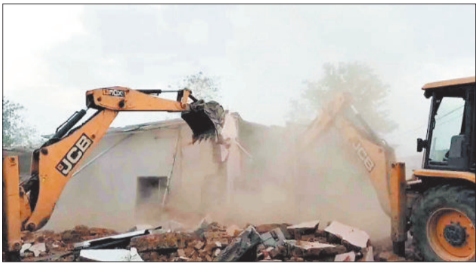
अवैध अतिक्रमण हटाया जैसीबी।