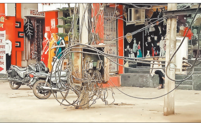
हरिभूमि न्यूज ►► बैकुण्ठपुर

शहर में बिजली के खुले फ्यूज बाँक्स संभावित दुर्घटनाओं को आमंत्रण दे रहे हैं, लेकिन इस ओर विद्युत वितरण कंपनी ध्यान नहीं दे रहा है।