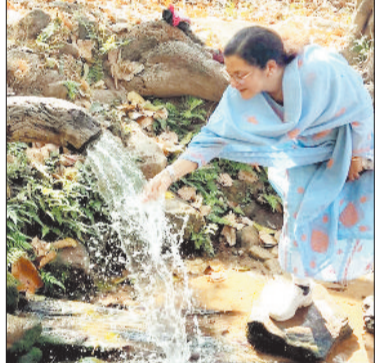
हरिभूमि न्यूज ►► बैकुण्ठपुर